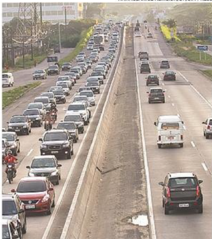
BR-232 recebe fluxo intenso entre a capital e o Agreste