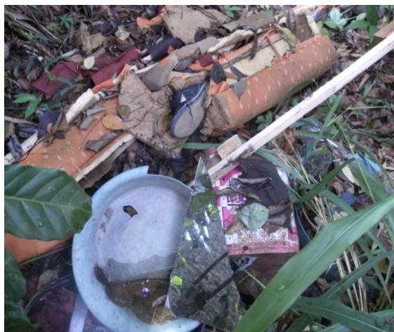
Figura 03. Deposição de lixo ao sul do JBR