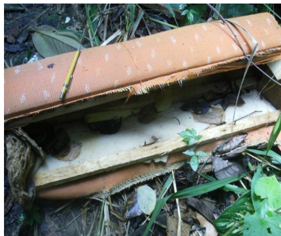
Figura 04. Deposição de lixo ao sul do JBR

A fragmentação decorrente da construção da BR-232 (Figura 05) pode acarretar uma série de mudanças na evolução de populações naturais da fauna e da flora no JBR, atingindo de forma diferenciada as taxas de mortalidade e natalidade das espécies. No caso de espécies arbóreas, a alteração na abundância de polinizadores, dispersores, predadores e patógenos alteram as taxas de recrutamento de plântulas; e os incêndios e mudanças microclimáticas, que atingem de forma mais intensa as bordas dos fragmentos, alteram as taxas de mortalidade de árvores (VIANA; PINHEIRO, 1998). Uma vez que os fragmentos são menores do que a área original da floresta, abrigam um número menor de espécies e de populações, o que reduz a probabilidade de persistência da biodiversidade em escala local e regional (TABARELLI; GASCON, 2005, ALMEIDA, 2008).