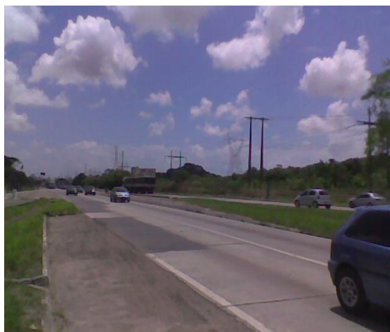
Figura 05. BR-232 ao norte do JBR

A fragmentação decorrente da construção da BR-232 (Figura 05) pode acarretar uma série de mudanças na evolução de populações naturais da fauna e da flora no JBR, atingindo de forma diferenciada as taxas de mortalidade e natalidade das espécies. No caso de espécies arbóreas, a alteração na abundância de polinizadores, dispersores, predadores e patógenos alteram as taxas de recrutamento de plântulas; e os incêndios e mudanças microclimáticas, que atingem de forma mais intensa as bordas dos fragmentos, alteram as taxas de mortalidade de árvores (VIANA; PINHEIRO, 1998). Uma vez que os fragmentos são menores do que a área original da floresta, abrigam um número menor de espécies e de populações, o que reduz a probabilidade de persistência da biodiversidade em escala local e regional (TABARELLI; GASCON, 2005, ALMEIDA, 2008).