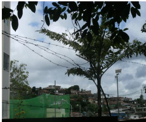
Figura 07: Invasão das áreas das margens a sudoeste do JBR