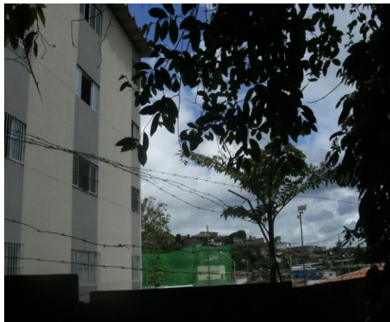
Figura 06: Expansão urbana ao sul do JBR

Contudo, observa-se que não há o cumprimento dessas leis no que se refere à faixa de restrições de uso do solo (Figuras 06 e 07), principalmente ao sul, sudoeste e a noroeste do JBR.